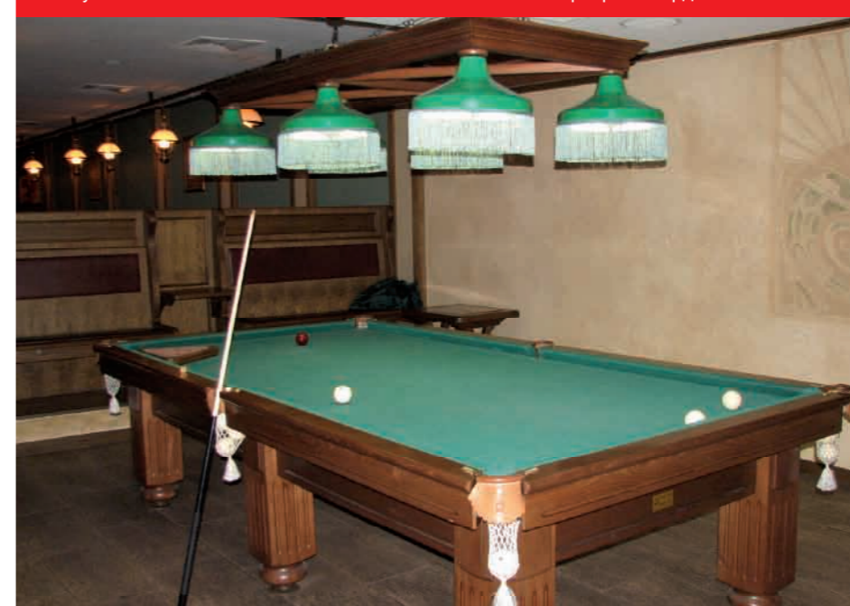
Бесшумные канальные блоки отлично вписываются в интерьер бильярдной

Материал предоставлен Ассоциацией Японские Кондиционеры, генеральным дистрибьютором General /Japan/ в России, странах СНГ и Балтии. www.general-russia.ru