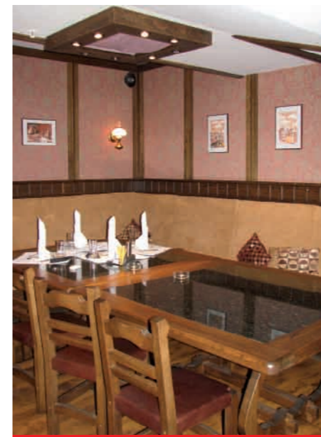
Зона отдыха для VIP гостей особенно нуждается в комфортной атмосфере

озонового слоя атмосферы. Высокая надежность системы обусловлена применением инверторной технологии, которая позволяет изменять производительность компрессора в соответствии с нагрузкой.