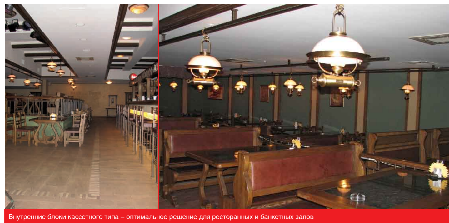
Внутренние блоки кассетного типа – оптимальное решение для ресторанных и банкетных залов

Экономичность системы достигается за счет высокого холодильного коэффициента (COP) оборудования, то есть отношения холодопроизводительности к потребляемой электрической мощности. Для системы VRF серии V коэффициент равен 3,2-3,7. Это означает, что для выработки 3,7 кВт холода потребуется всего 1 кВт электроэнергии. Причем стоимость 1 кВт холода, включая оборудование, материалы и монтаж, при кондиционировании торгового центра с помощью VRF системы V GENERAL /Japan/ составляет около 730$. То есть кондиционирование 1 кв. м обойдется примерно в 100$. Оборудование VRF серии V GENERAL /Japan/ экологически безопасно – фреон R410A, используемый в качестве хладагента, не является разрушителем